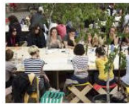
MORE Welcome to Lungomare... June 25, 2013