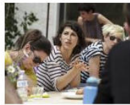
MORE Welcome to Lungomare Gasthaus... June 5, 2013