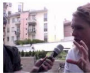
CULTURE + ARTS On air: die 500. Radiokultursendung... July 5, 2013