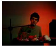
MORE Welcome to Lungomare Gasthaus... June 10, 2013