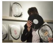
MORE Welcome to Lungomare Gasthaus... June 3, 2013