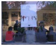
MORE La Banda dei Bandi: Lungomare Workshop Call... June 19, 2013