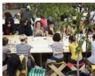
MORE Welcome to Lungomare... June 25, 2013