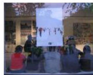
MORE La Banda dei Bandi: Lungomare Workshop Call... June 19, 2013