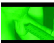
MUSIC Sie machen sich nicht die Mühe. "Napalm ist aller... July 9, 2013