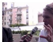
CULTURE + ARTS On air: die 500. Radiokultursendung... July 5, 2013