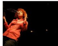
MORE Welcome to Lungomare Gasthaus... June 4, 2013