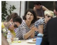
MORE Welcome to Lungomare Gasthaus... June 5, 2013