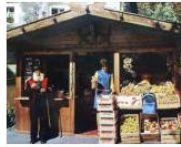
PEOPLE + VIEWS 10 buone ragioni per vivere in Alto Adige #61 June 3, 2013