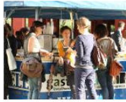
PEOPLE + VIEWS This was „franzmagazine: more than apples and... May 8, 2013