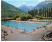
PEOPLE + VIEWS 10 buone ragioni per vivere in Alto Adige #60 May 13, 2013