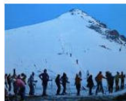
EDITORIALS 10 buone ragioni per vivere in Alto Adige #42. Holiday... January 7, 2013