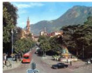
EDITORIALS Esercizio settimanale di ottimismo altoatesino #23 May 2, 2012