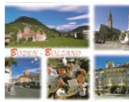
EDITORIALS 10 buone ragioni per vivere in Alto Adige #08 January 3, 2012