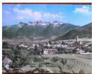
EDITORIALS Esercizio settimanale di ottimismo altoatesino #22 April 23, 2012