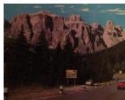
EDITORIALS 10 buone ragioni per vivere in Alto Adige #35 November 5, 2012