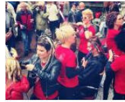
PEOPLE + VIEWS Basta un ricciolo e Piazza Erbe si trasforma May 30, 2013