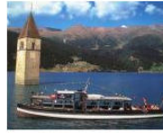
PEOPLE + VIEWS 10 buone ragioni per vivere in Alto Adige #59 May 6, 2013