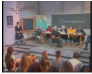
PEOPLE + VIEWS Il caldo brivido degli esami. Maturi e felici June 20, 2013