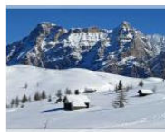
EDITORIALS 10 buone ragioni per vivere in Alto Adige #09 January 9, 2012