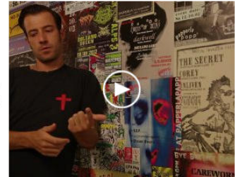
July 8, 2013