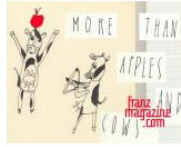
PEOPLE + VIEWS What about "franzmagazine: more than apples and... May 6, 2013