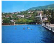
PEOPLE + VIEWS 10 buone ragioni per vivere in Alto Adige #62 June 17, 2013