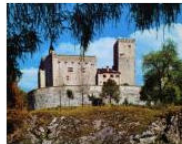
EDITORIALS 10 buone ragioni per vivere in Alto Adige #57 April 22, 2013