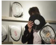
MORE Welcome to Lungomare Gasthaus... June 3, 2013