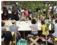
CULTURE + ARTS Welcome to Lungomare... June 25, 2013