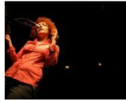
MORE Welcome to Lungomare Gasthaus... June 4, 2013