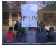
MORE La Banda dei Bandi: Lungomare Workshop Call... June 19, 2013