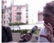
CULTURE + ARTS On air: die 500. Radiokultursendung... July 5, 2013