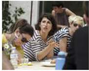
MORE Welcome to Lungomare Gasthaus... June 5, 2013