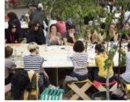
MORE Welcome to Lungomare... June 25, 2013