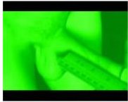
MUSIC Sie machen sich nicht die Mühe. "Napalm ist aller... July 9, 2013