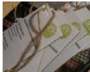
GALLERY Reopening G.A.P. and vernissage of Badarau... June 19, 2013