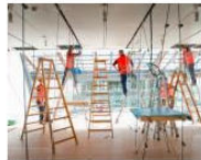
CULTURE + ARTS Il nuovo MUSE: quando è il Giona-museo a mangiare... June 19, 2013