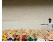
MORE Welcome to Lungomare Gasthaus... June 7, 2013