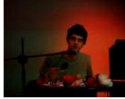
MORE Welcome to Lungomare Gasthaus... June 10, 2013