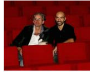
CULTURE + ARTS Behind Dance. Emio Greco tra libri, televisione... July 12, 2013