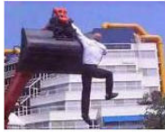
CULTURE + ARTS Behind Dance. Transports Exceptionnels - gli abitanti... July 14, 2013