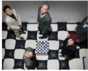
CULTURE + ARTS Mein Herz beats at Drodeseira: Teatro... July 17, 2013