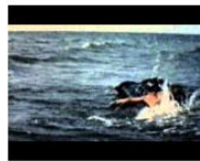
FRANZ SUGGESTS SATURDAY 23 + SUNDAY 24.2.13: ... February 18, 2013