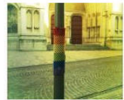
FRANZ SUGGESTS TUESDAY 26.2.13: Scheinwerfer auf... February 25, 2013