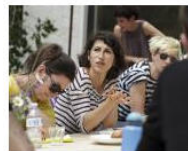
MORE Welcome to Lungomare Gasthaus... June 5, 2013