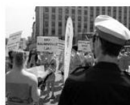
GALLERY abroad & overseas – Demo in Wien: Lieber nackt als... June 20, 2013