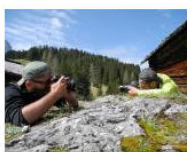
MORE La Banda dei Bandi: AVS Fotowettbewerb „Berge... June 24, 2013