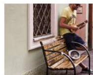
MUSIC La Banda dei Bandi: franz Street Music Festival July 12, 2013