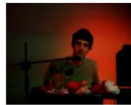
MORE Welcome to Lungomare Gasthaus... June 10, 2013