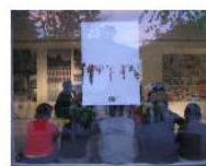
MORE La Banda dei Bandi: Lungomare Workshop Call... June 19, 2013