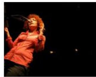
MORE Welcome to Lungomare Gasthaus... June 4, 2013