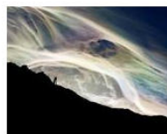
MORE La Banda dei Bandi: IMS Photo Contest 2013 July 15, 2013