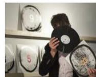
MORE Welcome to Lungomare Gasthaus... June 3, 2013