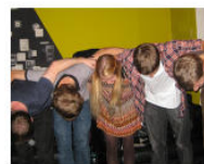
CULTURE + ARTS La Banda dei Bandi: Ausschreibung Text ohne... June 27, 2013