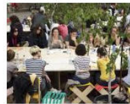
MORE Welcome to Lungomare... June 25, 2013